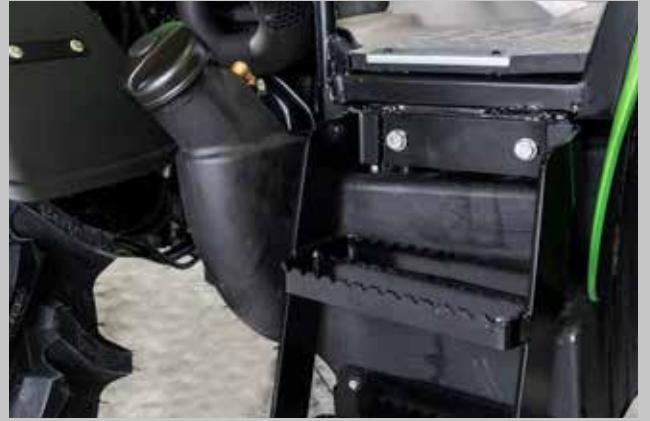
Yeni yakıt tankı konumu.