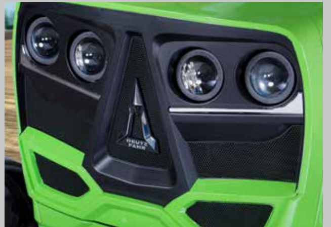
Mükemmel kaporta tasarımı.

Yeni tasarım ergonomik sağ ve sol konsollar renk kodları ile sınıflandırılmış kumanda sistemleri tarla faaliyetlerinizde sizlere kullanım rahatlığı sağlayacak.