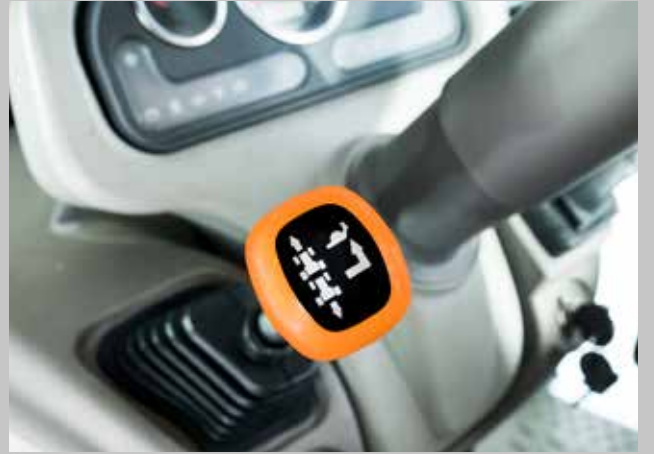
Direksiyon yanında shuttle ve Hi-Lo rahatlığı.

İlk bakışta kendine hayran bırakan kaporta tasarımı ile kullanım kolaylığı sağlayan mükemmel tasarım kabini bir arada bulacaksınız.