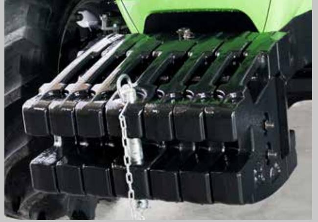
Yeni tasarım ön ağırlıklar.

4065E, 4075E ve 4080E modellerinde ek güç pistonu ile ağır işlerin üstesinden kolayca geleceksiniz. Tüm 4E modellerinde standart olarak sunulan 4 adet hidrolik güç çıkışı kullanmak istediğiniz ekipmanı uygulayabileceksiniz.