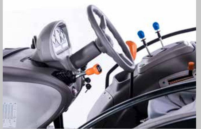
Rakipsiz ön konsol.