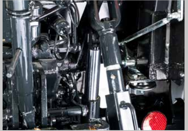
Ek güç pistonu ve 4 adet çıkış.