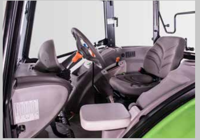
Geniş ve kullanışlı kabin tasarımı.